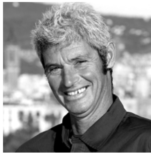
CHRISTOPHE JOLLAND COMMUNICATION | MAATCH !