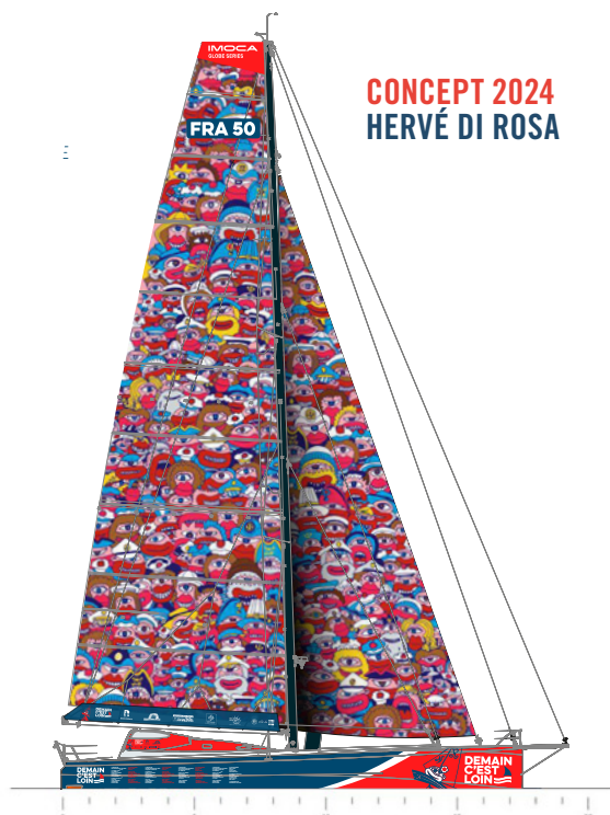
CONCEPT 2024 HERVÉ DI ROSA