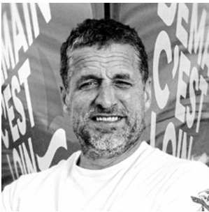
MATTHIEU BOYÉ COMMUNICATION | MAATCH !