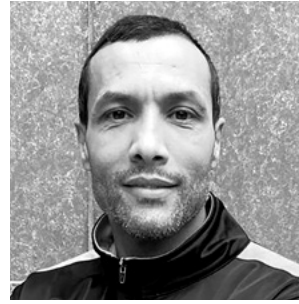
GAIA CORETTI RELATIONS PRESSE